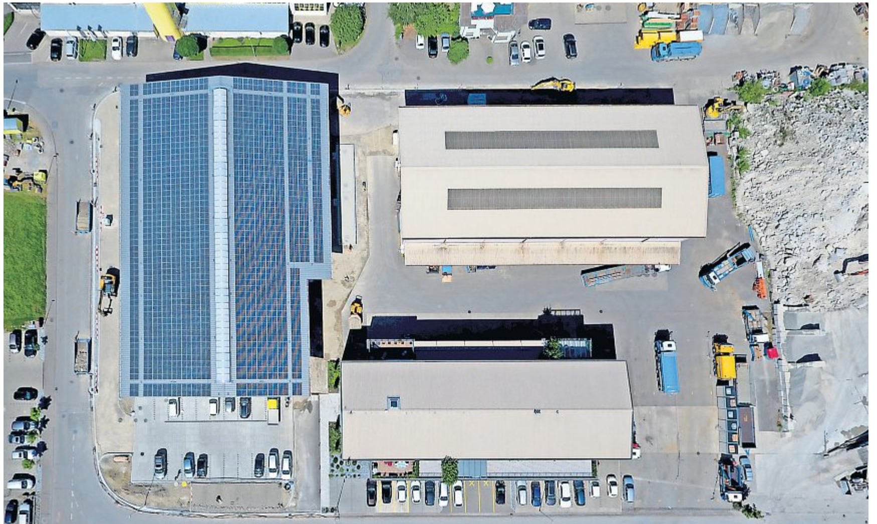
Auf der gesamten Dachfläche wurde eine riesige Photovoltaik-Anlage erstellt.

Seit dem offiziellen Spatenstich am 9. Januar 2020 hat sich vieles getan an der Seefeldstrasse. Im Februar 2020 wurde die Bodenplatte gegossen, abgeschlossen werden konnten die gesamten Beton-Arbeiten kurz vor Ostern. Dem Bauherrn war besonders der 100%ige Einsatz von Recycling-Beton bei allen Bauteilen wichtig. Im direkten Anschluss starteten die Stahlbauarbeiten für die Wand- und die Dachkonstruktion. Für den oberen Teil der Hallenwände wurden spezielle Pa-