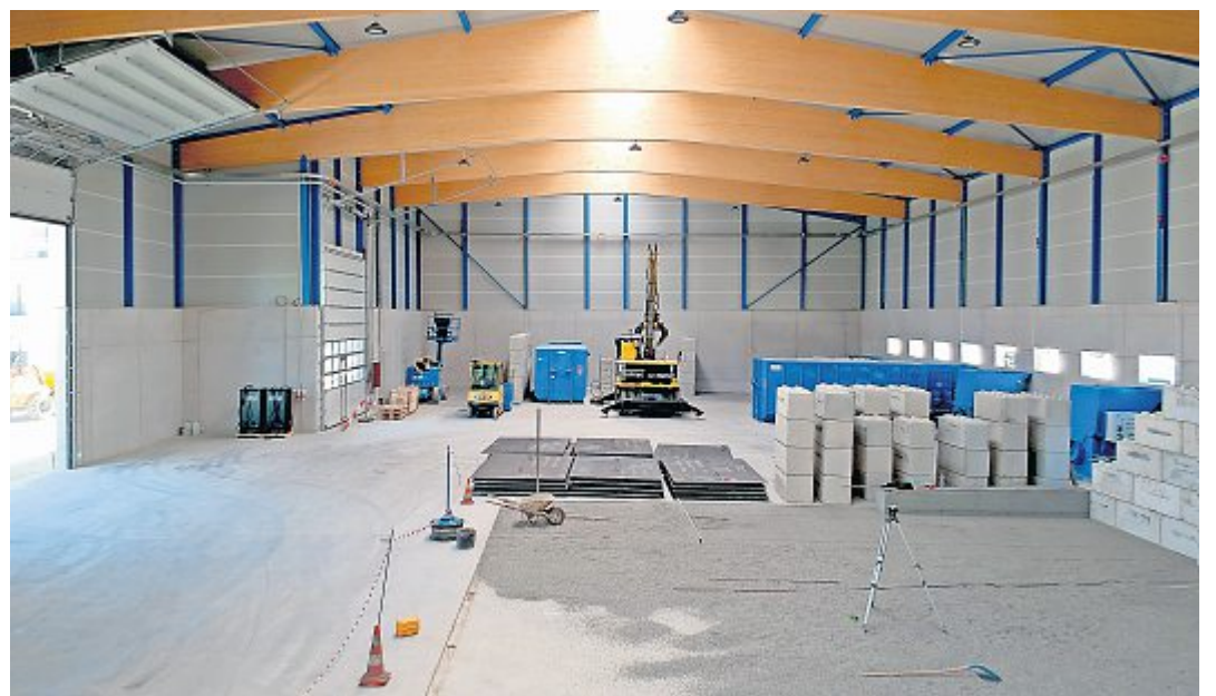
Seit dem offiziellen Spatenstich am 9. Januar 2020 hat sich vieles getan an der Seefeldstrasse.